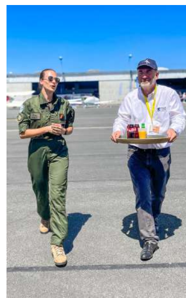
Découverte hélicoptères super Puma, H145, et échanges avec les équipages