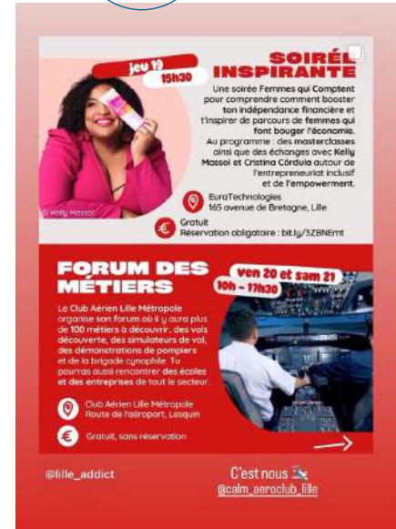
@LILLE ADDICT 518K FOLLOWERS