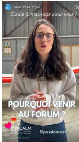
@PASSIONAERO 44,6K FOLLOWERS