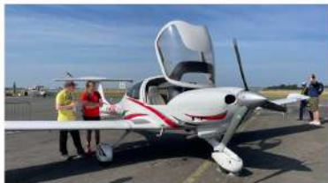
De nombreux avions sont présentés au public.

Le Club Aérien Lille Métropole (CALM) organise un forum des métiers de l'aéronautique ces vendredi et samedi 20 et 21 juin à Lesquin. Gratuit et ouvert à tous, ce rendez-vous a pour objectif est de faire découvrir les multiples débouchés de ce secteur.