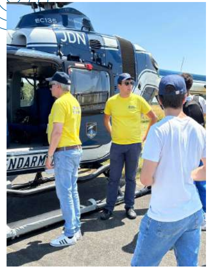
Echanges directs avec les professionnels de l'aéronautique