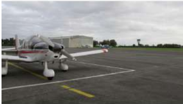
Le Club aérien Lille métropole accueillera la troisième édition de son forum des métiers de l'aéronautique.

Le Club aérien Lille métropole (CALM) organise la troisième édition de son forum des métiers de l'aéronautique les 20 et 21 juin prochains. Au programme : simulateurs de vol, découverte de métiers, démonstrations et bien d'autres.