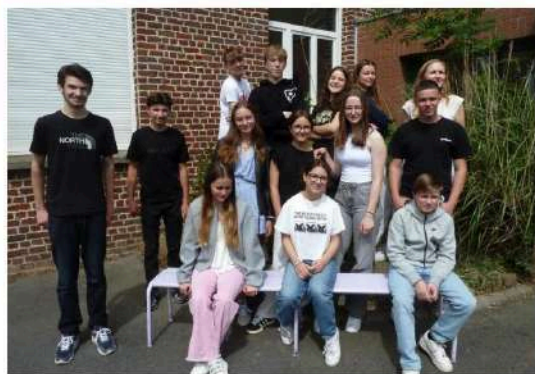
Les élèves se sont prêtés au jeu en reproduisant leur ancienne photo de classe.