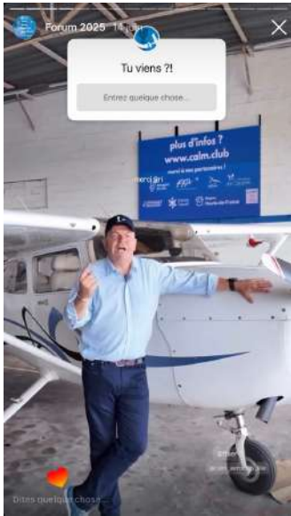
@RICOTPILOT 100K FOLLOWERS