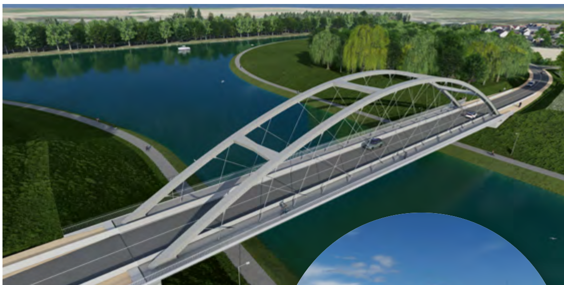
Le pont de la RD14E/71 à Oisy-le-Verger et le Canal entre Hermies et Ruyaulcourt

LE FUTUR CANAL DANS L'ARTOIS CAMBRÉSIS EN IMAGES