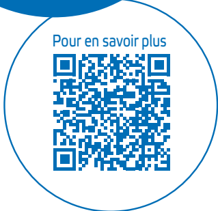
Pour en savoir plus

La Société du Canal Seine-Nord Europe s'est engagée à créer les conditions favorables à la massification des transports pendant le chantier. Cela passe notamment par la construction de 10 quais travaux et l'introduction d'une clause de report modal dans les marchés de travaux.