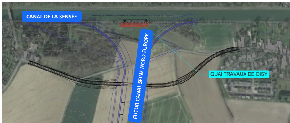
Position du quai travaux d'Aubenchoul-au-Bac

Le groupement d'entreprises SPIE BATIGNOLLES NORD, SPIE BATIGNOLLES VALERIAN et SPIE BATIGNOLLES FONDATIONS lancera la préparation du chantier sur 3 mois, et les travaux débuteront ensuite au 1 er trimestre 2025 et dureront 9 mois.