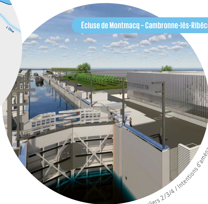
Écluse de Montmacq - Cambronne-lès-Ribécourt

© Team O+ / Ateliers 2/3/4 / Intentions d'aménagement