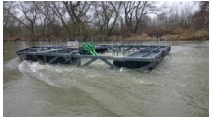
Hydrolienne en fonctionnement