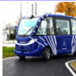
Express le cadre est fixé